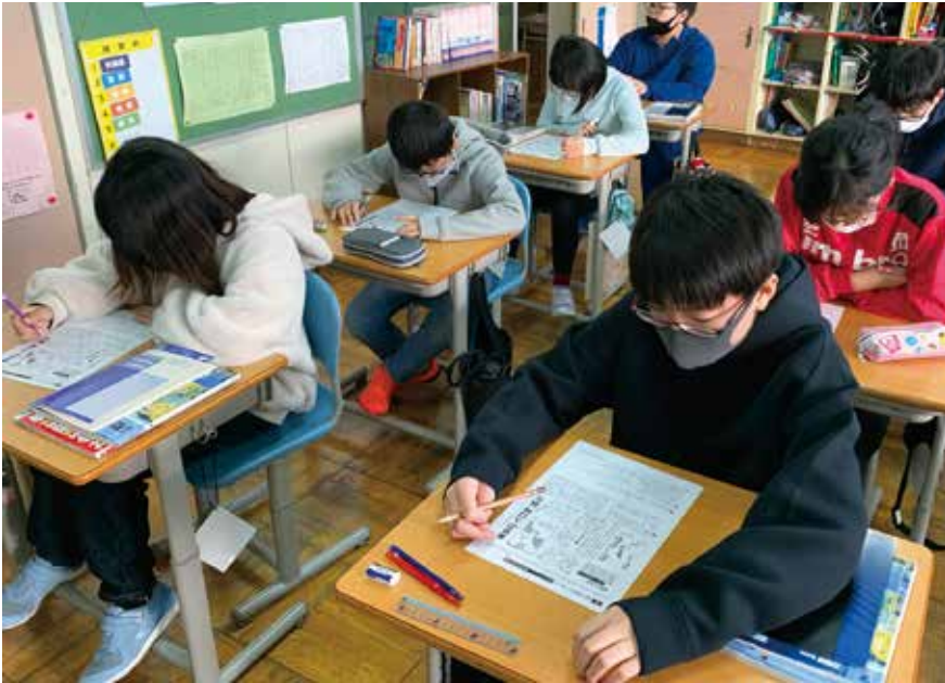
紋別小学校（北海道紋別市）での取り組み（2021年度）