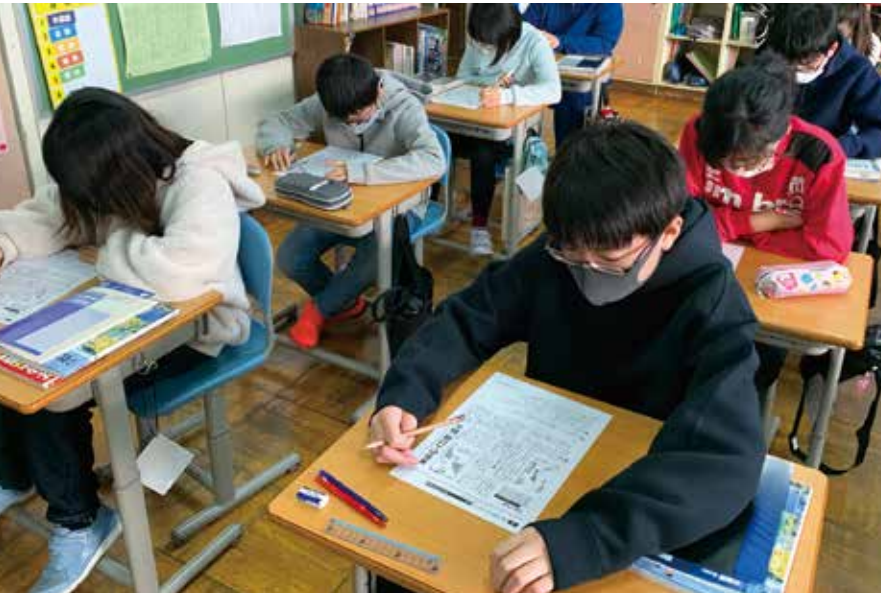
紋別小学校 (北海道紋別市) での取り組み (2021年度)