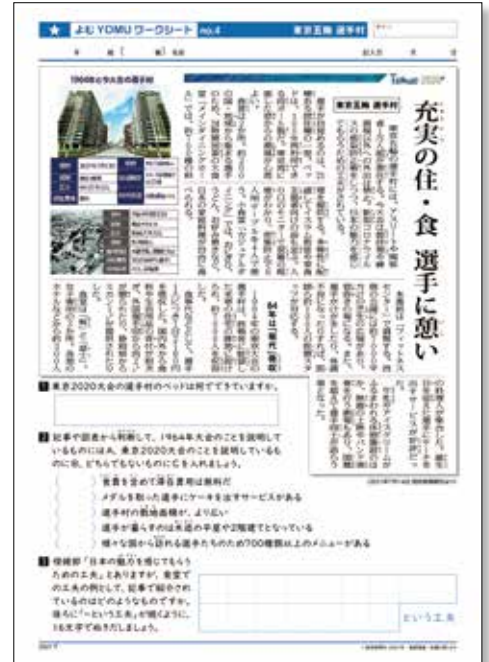
(1) 回答欄つきのワークシート