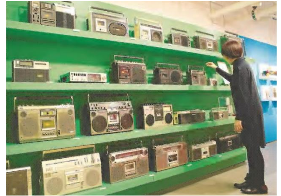
A customer looks at radio cassette players at an exhibition at the Ikebukuro Parco shopping complex in Toshima Ward, Tokyo.

By Yu Komagata Yomiuri Shimbun Staff Writer