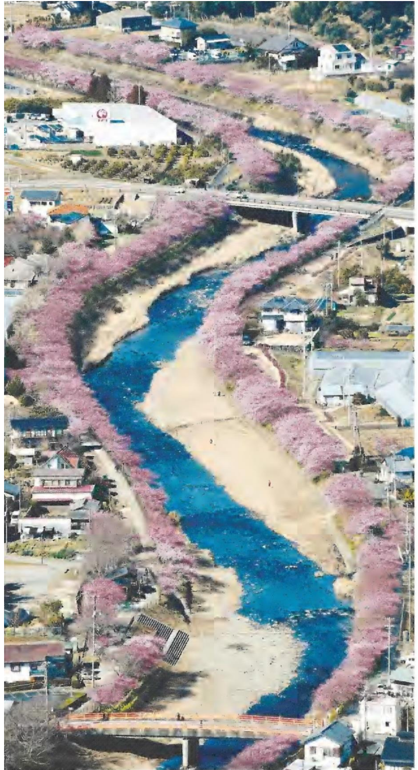
The Yomiuri Shimbun