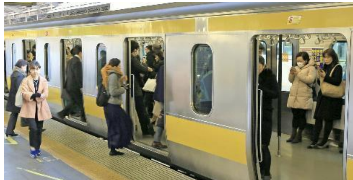
Passengers at JR Shinjuku Station in Tokyo stand in an East Japan Railway Co. train whose seats have been folded up during rush hour.

According to East Japan Railway Co. (JR East), the standing-only cars were introduced on the Yamanote Line in 1990. The fold-up seats were installed in two of the train's 11 cars, and they were tucked away for weekday services between the first train and 10 a.m. Another distinguishing feature was these cars had six doors on each side, rather than the usual four, to make getting on and off easier.